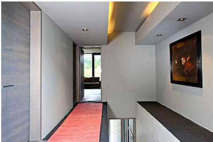
■ La vivienda cuenta con 560 metros cuadrados de construcción.