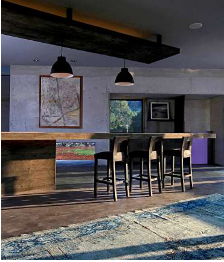
■ Sala, comedor y cocina conforman un solo ambiente.