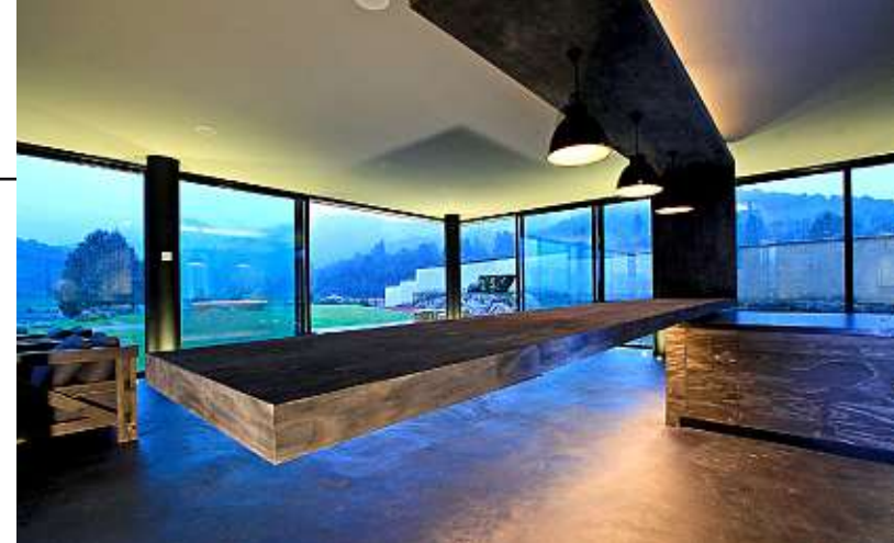
La barra de la cocina es un elemento suspendido.

“En el patio se puede experimentar un ambiente distinto gracias al tezontle como acabado final en el