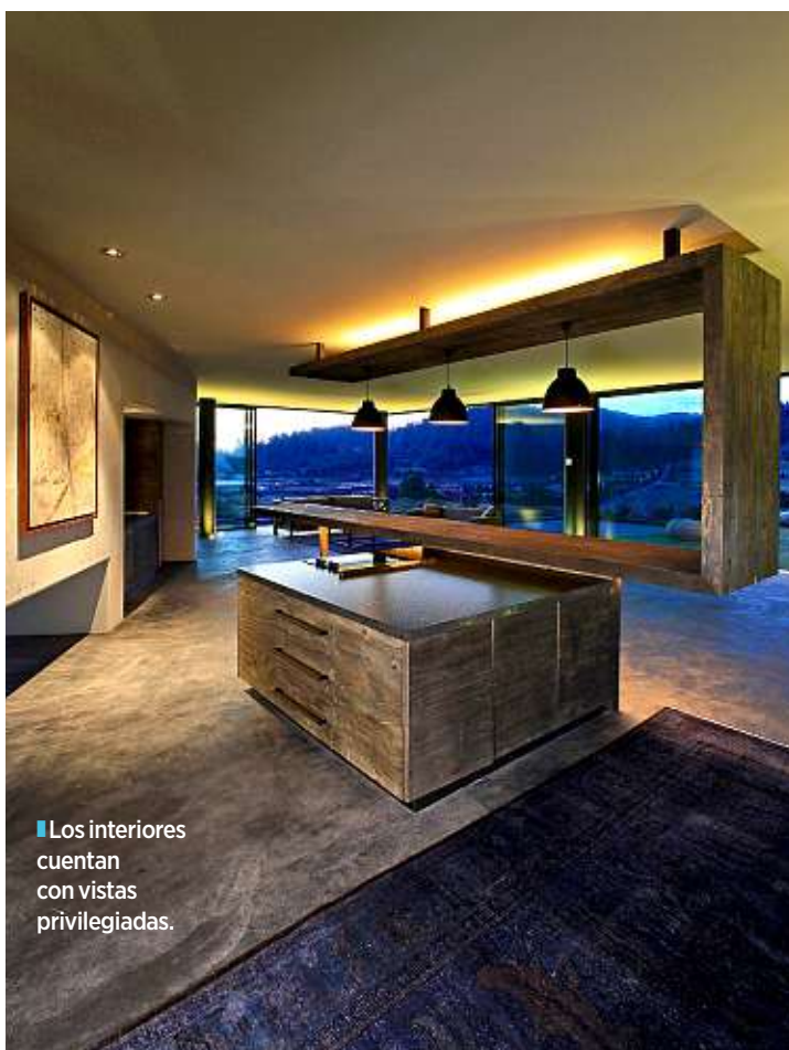
Los interiores cuentan con vistas privilegiadas.