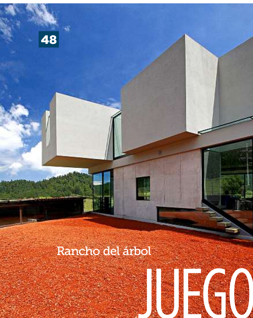
Rancho del árbol